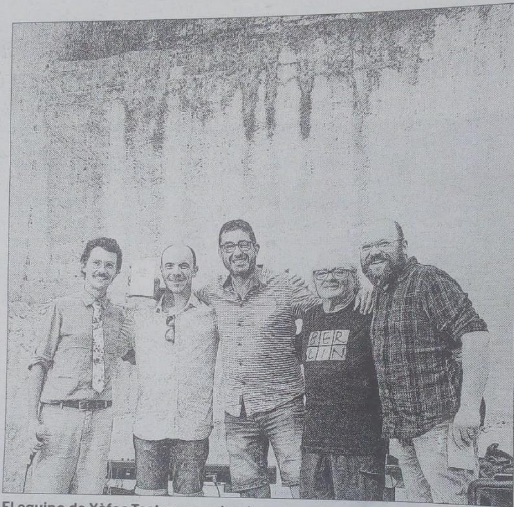
El equipo de Xàfec Teatre, recogiendo su premio.

triunfa en la primera edición del certamen